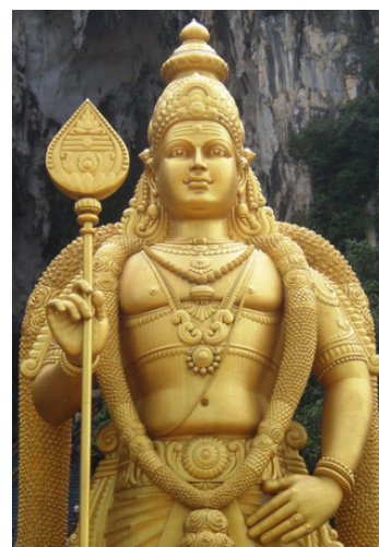
Murugan et sa lance

Mercure et Mars possèdent tous les deux les attributs du jeune garçon et du guerrier : Kuros pour Mercure, et Murugan ou Kumara, l'Adolescent vierge de 16 ans (1 et 6), pour Mars. Karttikeya est le Seigneur à 6 faces élevé par les 6 Krittikas (les Pléiades) car l'une d'elles demeure cachée. De la même manière, Sanat-Kumara se trouve au centre des 6 autres Kumaras à Shambhala, le règne des Vies planétaires, placé sous l'influence des 1 er , 3 e et 6 e rayons, rayons en relation avec Mars. Le démon Taraka peut représenter la Terre dont la Monade se trouve sur le 1 er aspect, ce qui lui vaut le nom de planète de la souffrance : elle incarne alors la Volonté engendrant la victoire de l'Esprit sur la matière, de la Vie sur la mort, procurant la Liberté (dans son sens le plus élevé). A ce titre, le jaïnisme appelle ses maîtres des vainqueurs (jinas) et le dernier jaïn n'est autre que Mahavira, le grand héros. Tous les terriens qui deviennent des Maîtres sont en fait des vainqueurs, des victorieux de leur démon. Taraka peut aussi représenter Pluton, la planète de 1 er rayon au niveau de la personnalité dont la volonté est purement destructrice. Mars joue le rôle de grand frère pour Pluton avec qui il est couplé. De la même manière, il est courant de considérer Uranus comme l'octave supérieur de Mercure.