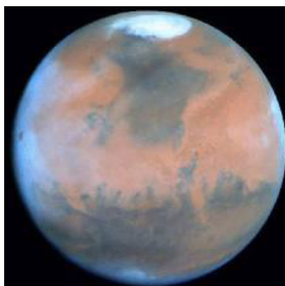
Mars la planète rouge

La Volonté persévérante de Mars peut nous permettre de faire face à toutes les épreuves que la vie place sur notre chemin. La loi du karma nous assure que toute épreuve qui nous est présentée peut être surmontée. Mars fait de nous le guerrier prêt à assumer la bataille, et la plus grande parmi toutes reste la bataille menée en nous-même contre nos mirages. Les mirages résultent des vies vécues par l'humanité dans le monde astral ou émotionnel depuis des millions d'années. La maîtrise de notre vie émotionnelle est l'une des initiations les plus dures à passer. Auparavant, des centaines de milliers de vies furent nécessaires avant que le Bélier ne nous place sur le sentier de la vie spirituelle. Ensuite, les Poissons nous attendent pour le grand renoncement (la 4 e initiation), pour lequel le renoncement à la vie de désir dans le Scorpion ne fut qu'une préparation.