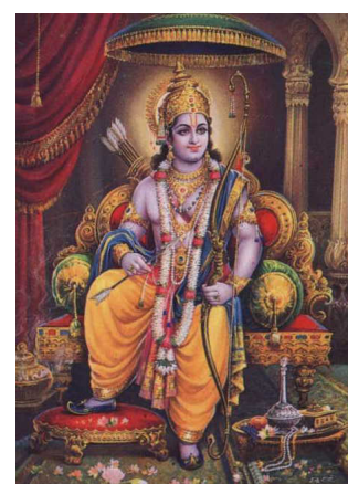
Rama et son arc