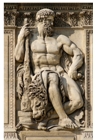
Hercule et sa massue