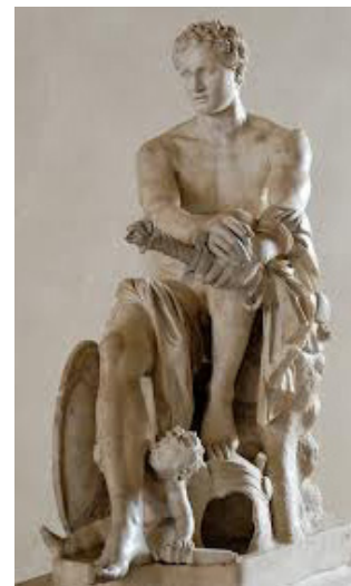
Arès - Mars et son épée