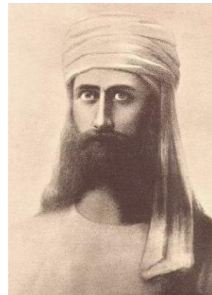
Morya Maître du 1 er rayon

Il est courant de penser Dieu exclusivement sous son aspect Amour. Mais les ésotéristes et ceux qui connaissent les mythologies du monde entier savent que depuis l'aube de la création existe une guerre dans le ciel. Entre les Dieux et les Démones disent les mythes. Plus justement, entre la Volonté de Bien et la Volonté du Mal. La voie du guerrier consiste à mettre la Volonté de Bien au service du plus faible et à contrecarrer ainsi la Volonté du Mal qui domine par la force le plus vulnérable. Selon les enseignements ésotériques, les deux guerres mondiales furent une résurgence de l'ancien conflit atlante vécu dans le signe du Scorpion. Ces conflits furent la précipitation de la guerre dans le ciel, appelé tarakamaya par les Indiens et titanomachie par les Grecs : une lutte qui trouve sa source sur les niveaux inférieurs du plan Astral cosmique, lieu de la Loge Noire cosmique. De la même manière que la conduite de la guerre mondiale fut placée sous la responsabilité du Maître Morya, la lutte et la victoire sur le Mal cosmique concernent finalement les Grands Etres qui se trouvent sur le 1 er rayon. La Volonté de Bien triomphera de la Volonté du Mal, qui, en définitive, n'est qu'un mauvais usage de la Volonté appliquée au monde de la matière.