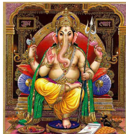
Ganesha et le trident de Shiva

la Régénération, possède deux fils : Ganesha (Mercure) et Karttikeya (Mars), ce dernier étant également nommé Murugan, Skanda ou Kumara. Ganesha est le Dieu mercurien invoqué pour inaugurer les débuts et les fins de cycle, pour protéger les lieux sacrés et détruire les obstacles. Il est aussi un Dieu de la sagesse, du savoir, et ses épouses Buddhi (éveil) et Siddhi (faculté psychique) montrent son rapport avec Mercure. L'éléphant, animal de 1 er rayon, sert de véhicule à Ganesha qui incarne l'Inde dont l'âme se trouve sur le 1 er rayon et la personnalité sur le 4 e rayon. Le tantrisme rattache l'éléphant au centre de la base, le foyer du 4 e rayon (le rayon d'âme de Mercure) et le réservoir de la volonté de vivre, de conditionner la vie dans la forme, en rapport avec la kundalini. Le 1 er et le 4 e rayon relie la couronne au centre de la base.